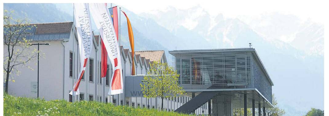
Die Universität Liechtenstein informiert über ihre Weiterbildungen.

VADUZ Die Finanzplätze befinden sich in einem Prozess des Wandels. Damit unabdingbar verbunden ist die ständige Weiterbildung der Finanzplatz-Akteure. Am Montag, 23. Juni 2014, ab 18.30 Uhr stellt das Institut für Finanzdienstleistungen der Universität Liechtenstein die Weiterbildungsangebote mit Start ab Herbst 2014 vor. Die stetigen Änderungen insbesondere im rechtlichen, regulatorischen und steuerlichen Umfeld verändern die Berufsbilder in der Unternehmens-, Banken-, Steuerberatungs-, Treuhand-, Versicherungs-, Verwaltungs- und Beratungspraxis. Darüber hinaus verlangen die zunehmende Mobilität der Kunden und deren Familienmitglieder sowie des Kapitals internationale und interdisziplinäre Kenntnisse, um eine umfassende und bedarfsgerechte Beratung vornehmen zu können. Grenzüberschreitendes Know-how ist heute unabdingbar geworden.