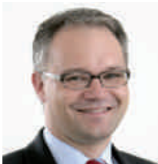
Dr. Klaus Tschütscher

von Regierungschef-Stellvertreter Dr. Klaus Tschütscher