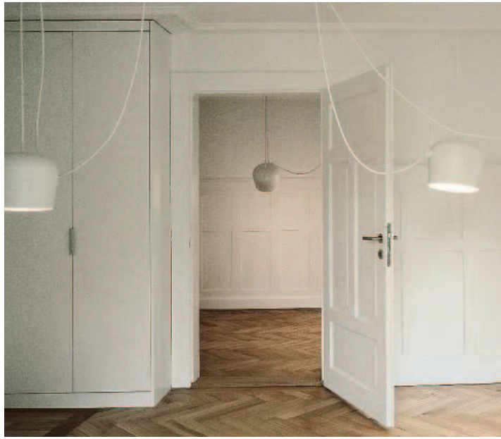
Das Dachgeschoss der «Villa Wirbelwind» wurde zu einem Bewegungsraum ausgebaut, das Parkett blieb ebenfalls erhalten.