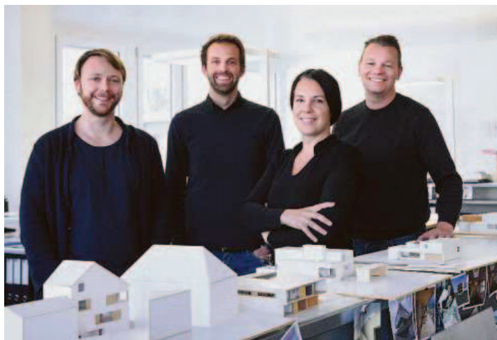
Das Team des ArchitekturAtelier in Vaduz.

Oft werden Renovationen als notwendiges Übel angesehen. Auch bei diesem Bauvorhaben wurden wir von manch schlechter Bausubstanz überrascht und mehrere Holzbalkendecken mussten ersetzt werden. Jedoch verglichen zu den Qualitäten, die solch einem alten Gebäude innewohnen, wurde dies gern in Kauf genommen. Wir hoffen, mit diesem Umbau vor allem den zukünftigen Nutzern und Besuchern eine Freude machen zu können und wünschen ihnen viel Vergnügen beim spielerischen Einnehmen des Hauses und dem abwechslungsreichen Erleben von Alt und Neu. (pd)