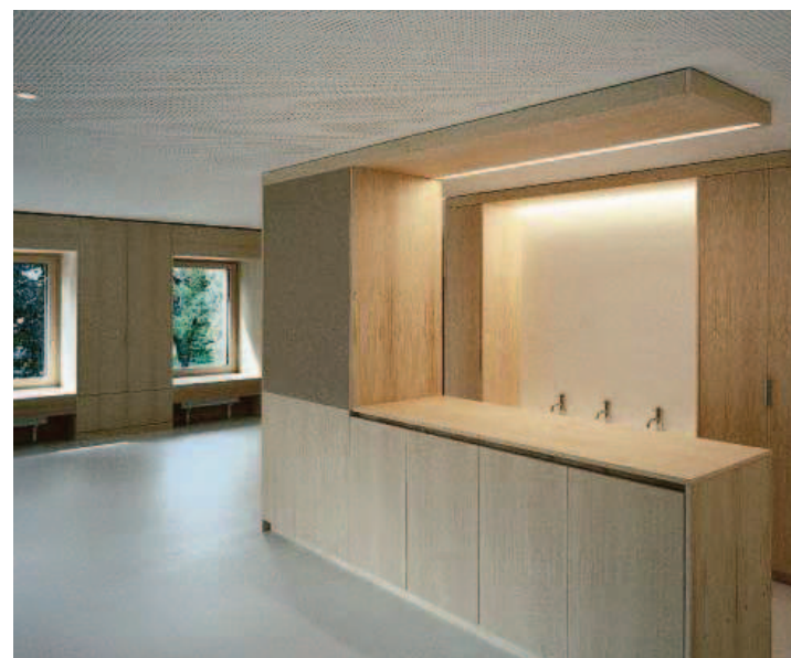
Die altherwürdige Villa in der Äulestrasse 46 wurde innerhalb von nur 15 Monaten in eine top-moderne und charaktervolle Kindertagesstätte mit einer Nutzfläche von 550m 2 verwandelt. Wer sich die «Villa Wirbelwind» anschauen möchte, hat diesen Samstag am Tag der offenen Tür die Möglichkeit dazu. Ab 11.30 Uhr kann jeder durch die Villa schlendern und die Kita kennenlernen.